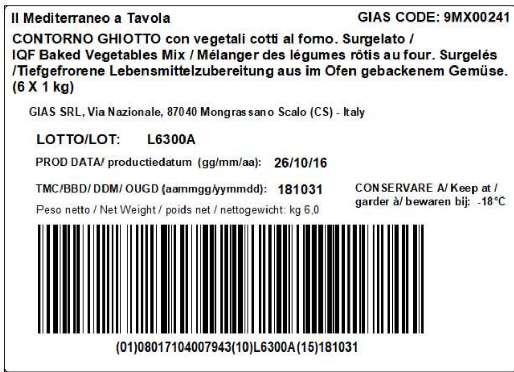
Figura 3 - Esempio di etichetta tracciabilità pallet:

Figura 2 - Esempio di etichetta tracciabilità cartone: